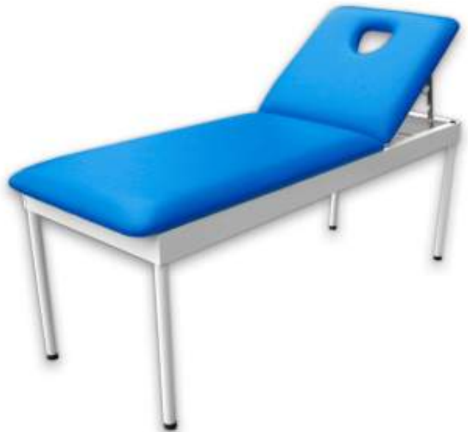
MESA DE EXAMEN DE MASAJES Cod. LM000191