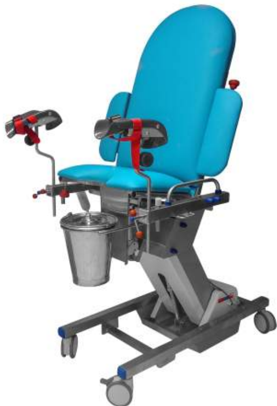
MESA ELÉCTRICA DE PARTO VERTICAL Cod. LM000210