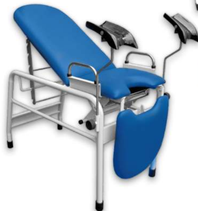
MESA GINECOLÓGICA PARA TÓPICO Cod. LM000203