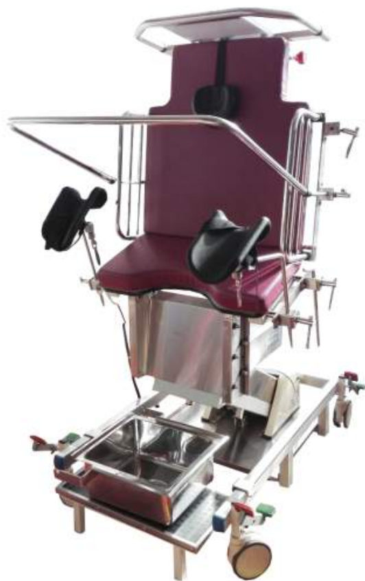
CAMA ELÉCTRICA DE PARTO VERTICAL Cod. LM000220