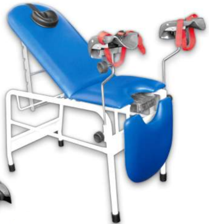
MESA GINECOLÓGICA ARTICULADA Cod. LM000202