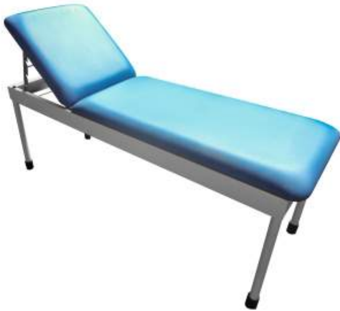
MESA DE EXAMEN ESTANDAR Cod. LM000190