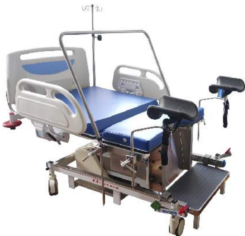
MESA ELÉCTRICA PARA PARTO VERTICAL Y HORIZONTAL ABS Cod. Lm 00221