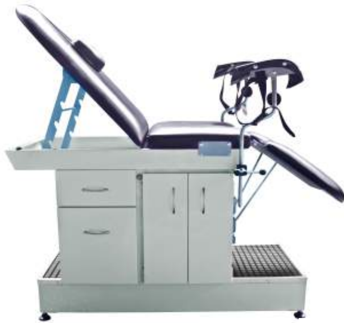
MESA GINECOLÓGICA AMOBBLADA Cod. LM000201