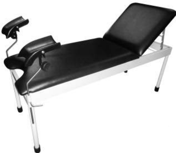
MESA GINECOLÓGICA ESTÁNDAR Cod. LM000200